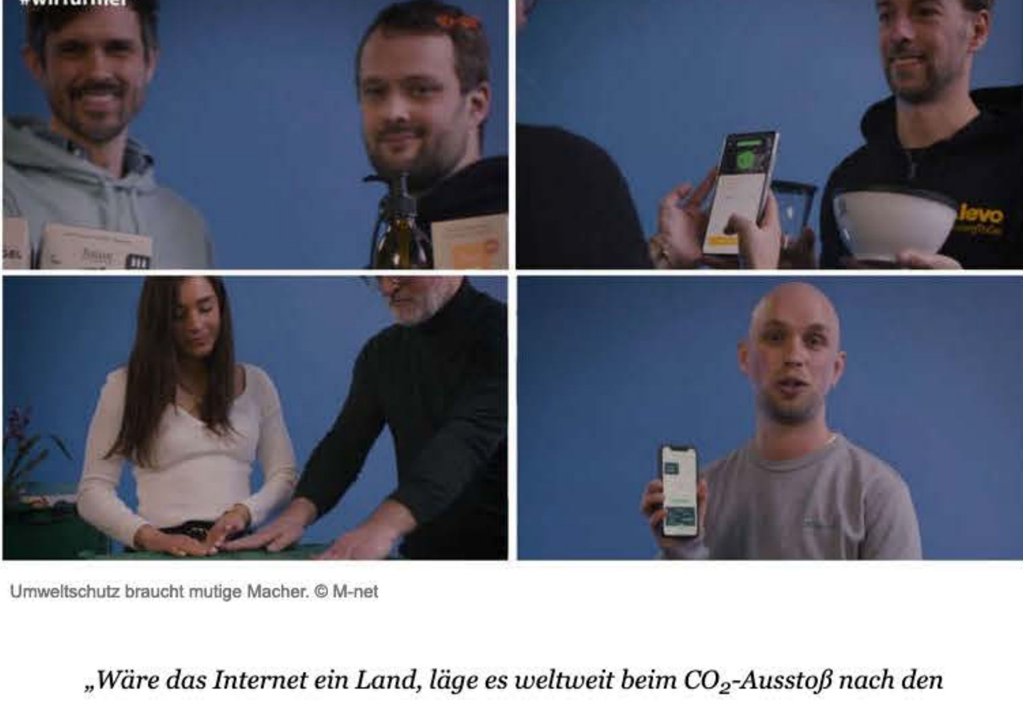
Umweltschutz braucht mutige Macher.

„Wäre das Internet ein Land, läge es weltweit beim CO 2 -Ausstoß nach den größten Industrieländern auf Platz 6.“